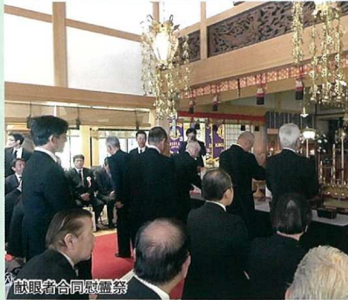
献眼者合同慰霊祭