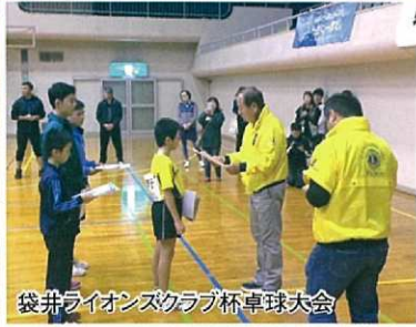
袋井ライオンズクラブ杯卓球大会