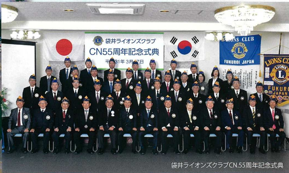
袋井ライオンズクラブCN.55周年記念式典

ラグビーワールドカップ2019™日本大会9月に開催 小笠山総合運動公園エコパスタジアムにて3試合が行われます