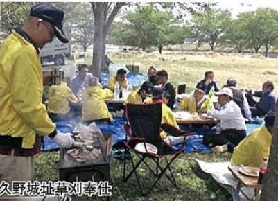
久野城址章刈奉仕