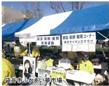
袋井市ふれあい夢市場

市社協に10万円 袋井ライオンズクラブ アは10日、現金10万円を袋井市社会福祉協議会に贈った。関係者は「市移住センター」も地域の役に立てば、池谷の勇気長を祈った。