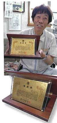
東光ライオンズクラブより感謝状授与