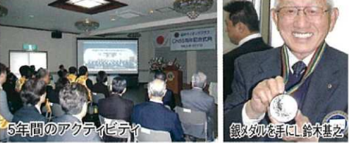
5年間のアクティビティ