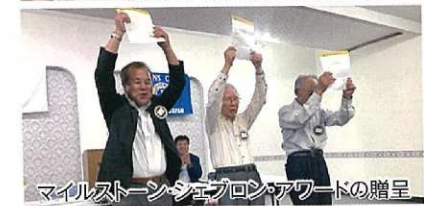
マイルストーン・シェブロン・アワードの贈呈