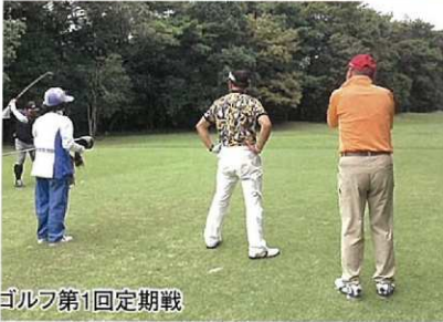
ゴルフ第1回定期戦