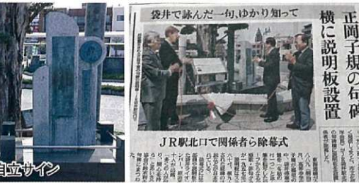
JR駅北口で関係者ら除幕式