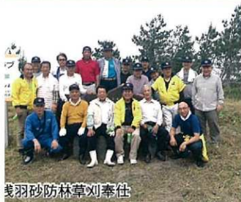
浅羽砂防林草刈奉仕

市社協に10万円 袋井ライオンズクラブ アは10日、現金10万円を袋井市社会福祉協議会に贈った。関係者は「市移住センター」も地域の役に立てば、池谷の勇気長を祈った。