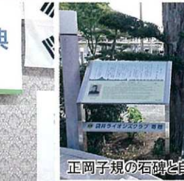
正岡子規の石碑と自立サイン