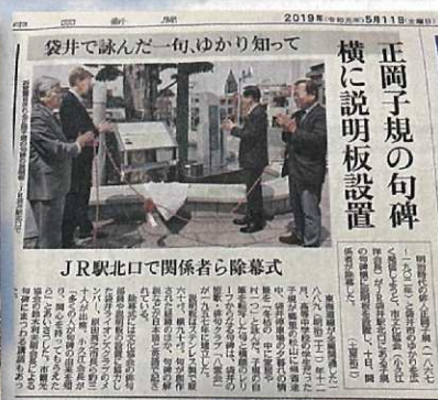
袋井市文化協会へ看板の寄贈