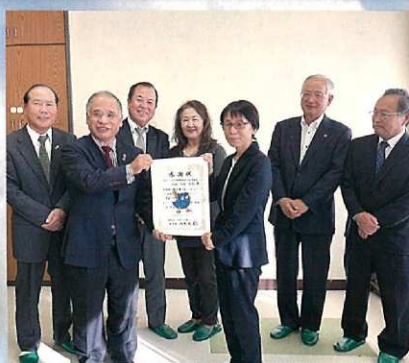
静岡県障害者スポーツ協会へ