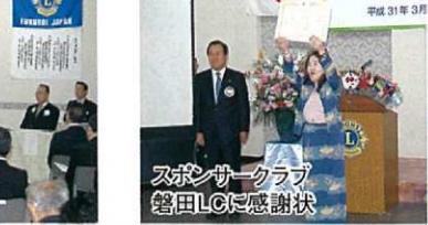
スポンサークラブ 磐田LCに感謝状