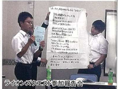
ライオンズクエスト参加報告会