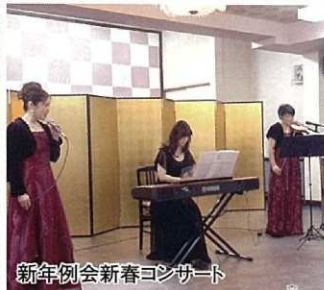
新年例会新春コンサート