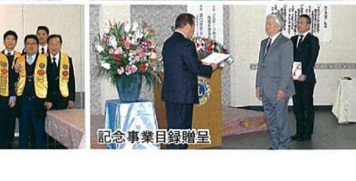
記念事業目録贈呈