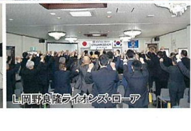
L岡野良隆ライオンズローア