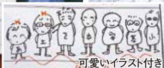
可愛いイラスト付き