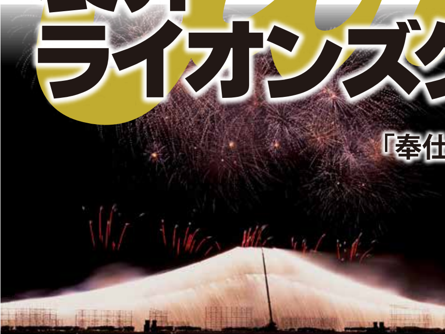
ふくろい遠州の花火