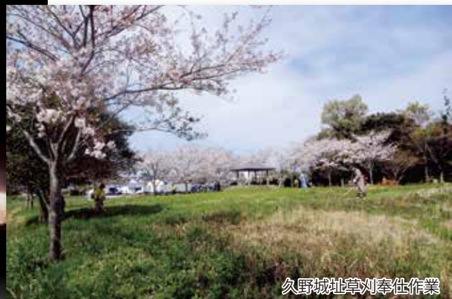
久野城址草刈奉仕作業