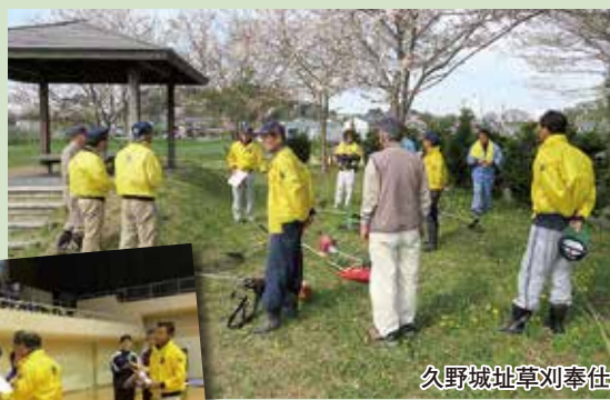
久野城址草刈奉仕