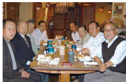
年会報編集について打ち合わせをするPR・情報委員会