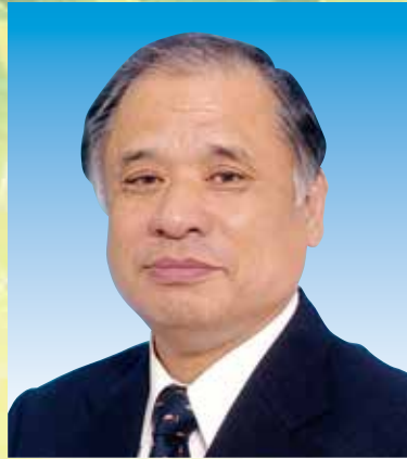
袋井ライオンズクラブ