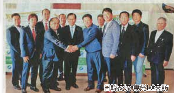
日韓交流 東光LC来訪

奉仕を通して自らの幸福、社会全体が明るく楽しい生活環境、みんなやさしい幸福を目指して頑張ります。