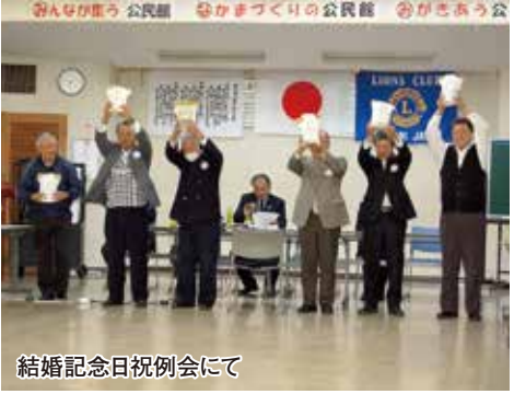
結婚記念日祝例会にて