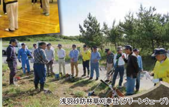
浅羽砂防林草刈奉仕(グリーンウェーブ)