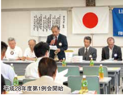
平成28年度第1例会開始