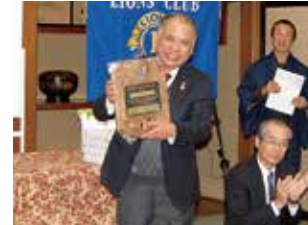
メルビン・ジョーンズ・フェロー賞 L.太田会長