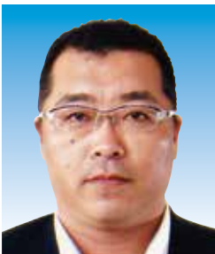
青少年クエスト委員長