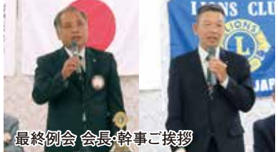
最終例会 会長・幹事ご挨拶