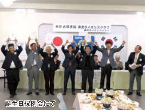
誕生日祝例会にて