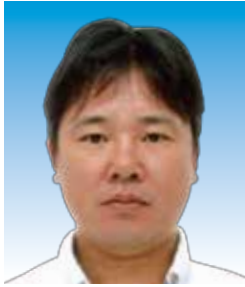
環境保全保健委員長