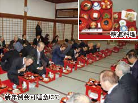
新年例会可睡齋にて