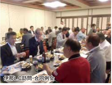
伊那L.C訪問・合同例会