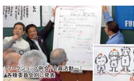
ワークショップ例会「会員活動～」 各種委員会別に発表