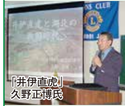
「井伊直虎」 久野正博氏