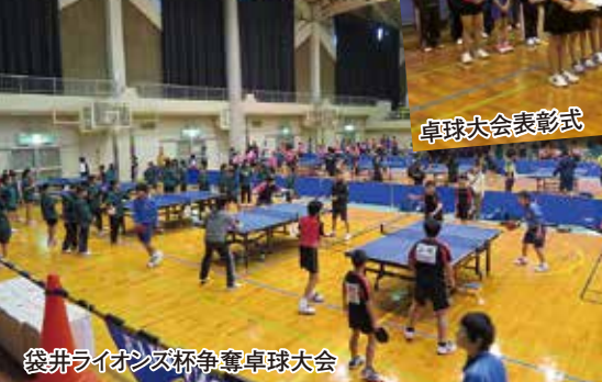
袋井ライオンズ杯争奪卓球大会