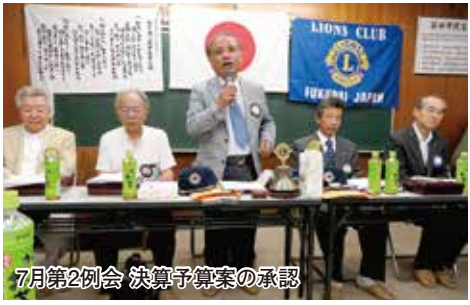
7月第2例会 決算予算案の承認