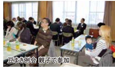
豆まき例会 親子で参加