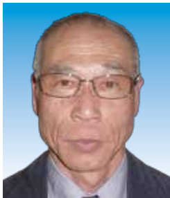
テールツイスター

もう1年続けて会計をやらせて頂きますが、今後もライオンズの活動を通じ、会員の皆様との友情を育むと同時に、先輩会員の皆様にご指導賜り、地域社会に少しでも貢献できるよう頑張っていく所存です。これからもよろしくお願い申し上げます。