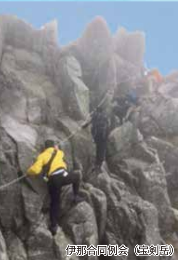
伊那合同例会（宝剣岳）