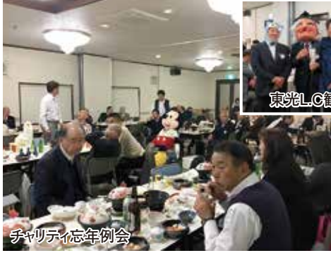
チャリティ忘年例会