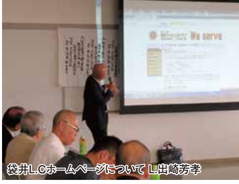
袋井L.Cホームページについて L出崎芳孝