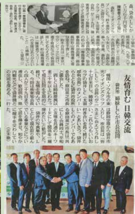
友情育む 日韓交流 袋井市 姉妹L.Cが市長訪問