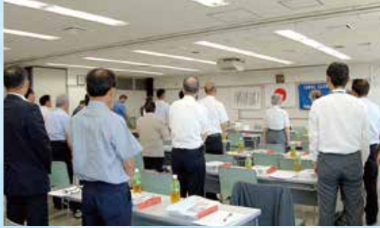
平成28年第一例会開始